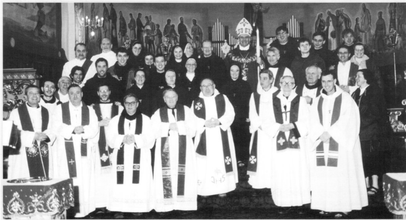
La celebrazione è terminata. Il Vescovo con i Sacerdoti e i Missionari posano per una foto di gruppo.