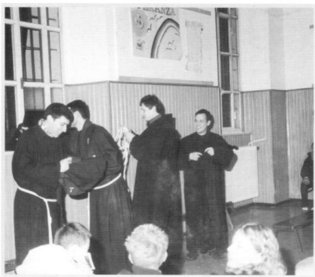
I Novizi, durante l'incontro degli adolescenti, si preparano ad animare la serata.

Nei due giovedì della Missione, nella casa delle Suore di S. Marta si sono incontrati gli Adolescenti; e nella comunità "mondo X", si sono dati appuntamento i Giovani. Gli incontri, caratterizzati dalla gioia che è propria degli adolescenti e dei giovani, sono stati partecipati e vissuti alla luce della preghiera e della meditazione dei valori evangelici, indispensabili nelle scelte di vita di chi si apre ad essa con fiducia e passione.