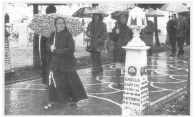
In un clima di preghiera profonda e convinta, arriviamo al cimitero