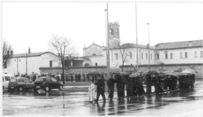
Ritrovo alle ore 14.30 nella Chiesa di S. Nicola e dopo un momento comunitario di preghiera: partenza per il cimitero.

E' una giornata fredda e piovosa, nonostante il maltempo, la chiesa di S. Nicola è gremita di cristiani che sentono forte il desiderio di vivere questo pellegrinaggio sulle tombe di coloro che ci hanno preceduto nella vita di fede e che ora, riposano in pace nell'attesa della risurrezione finale.