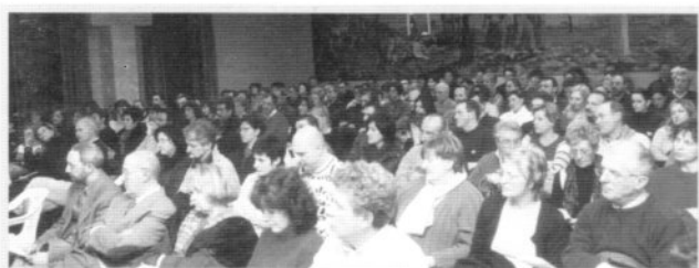
Numerosa la partecipazione delle coppie delle nostre parrocchie