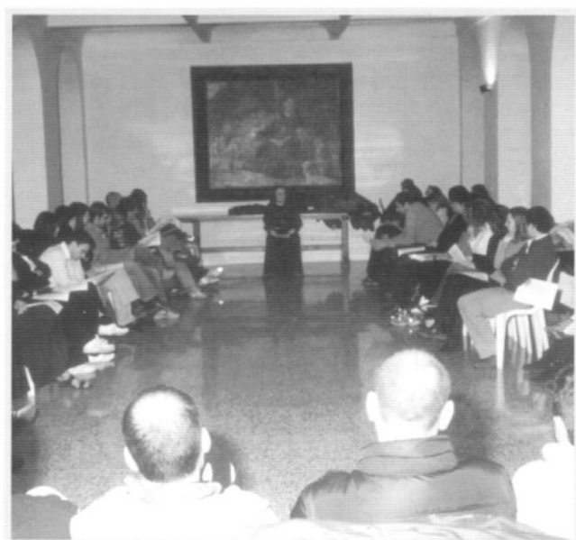
Un altro momento dell'incontro per i giovani. E' il momento del dialogo e della condivisione.