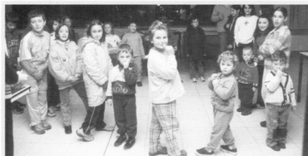
Servizio "baby sitter" - Mentre i genitori pregano e meditano, i loro figli, aiutati dagli animatori dell'oratorio, si divertono nel giuoco.