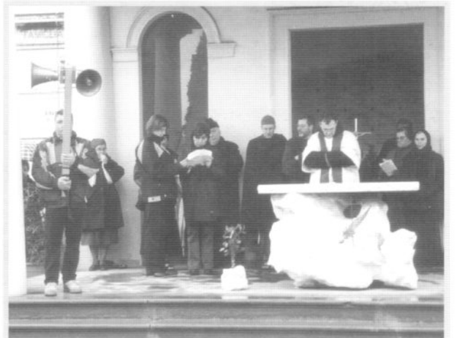
E' Fra Marco che propone la riflessione, portando tutti i pellegrini a considerare la speranza che ogni cristiano vive nella luce di Cristo Risorto. Viene proposta anche una riflessione sui Novissimi: morte-giudizio-inferno e paradiso.