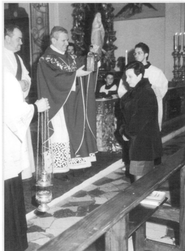
siamo all'offertorio: vengono portati, oltre al pane e al vino, tre simboli della missione: il vangelo (che è stato portato in ogni famiglia), i sandali simbolo del cammino del missionario) e una lampada accesa. (simbolo del cristiano che cammina nella luce di Cristo Risorto)