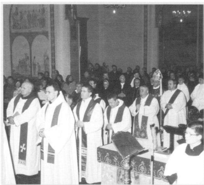
Inizia la S. Messa concelebrata dai Sacerdoti e Frati.