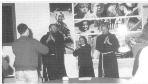
Alla scuola materna: incontro per gli sposi più giovani.