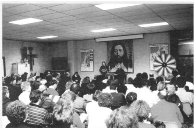
Oratorio di Padergnone: incontro per le coppie oltre i 10 anni di matrimonio. Il Padre maestro dei Novizi francescani detta una riflessione per gli sposi.

"FAMIGLIA, DIVENTA CIO' CHE SEI", recitava lo slogan che ha accompagnato questi due incontri, come pure le celebrazioni di Domenica 14 marzo, caratterizzate dal rinnovo delle promesse matrimoniali da parte di tutti gli sposi e in tutte le parrocchie.