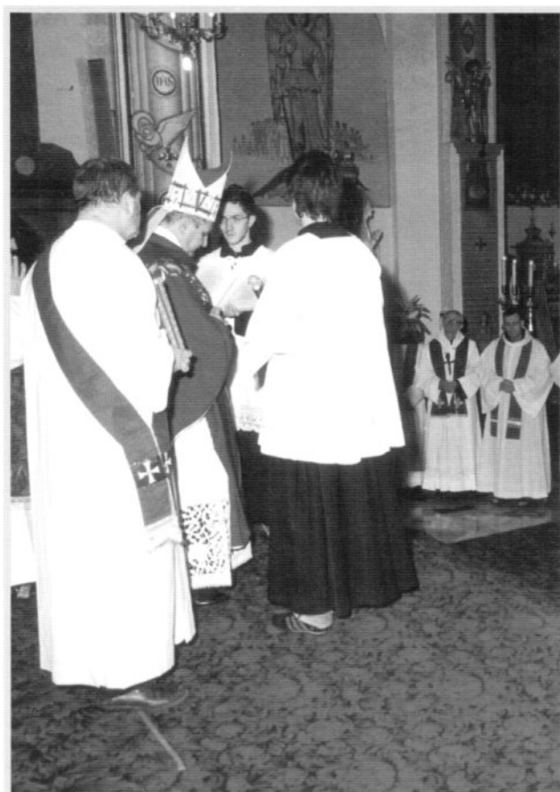
Al termine dell'omelia, il Vescovo consegna il "Mandato" ai frati e suore missionari e pone al collo di ciascuno il famoso "Tau", simbolo tanto caro a S. Francesco.